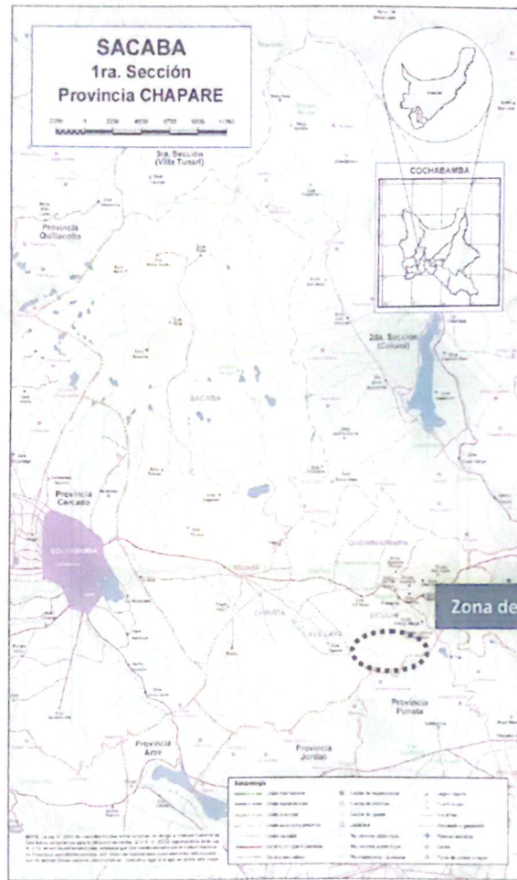
Ubicación Física Del Proyecto